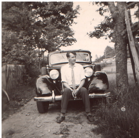
En stolt man och hans bil.

Jag och mina kusiner kunde sitta i timmar och låtsasköra bilen, veva upp och ner rutorna och kolla på alla knappar och finesser.