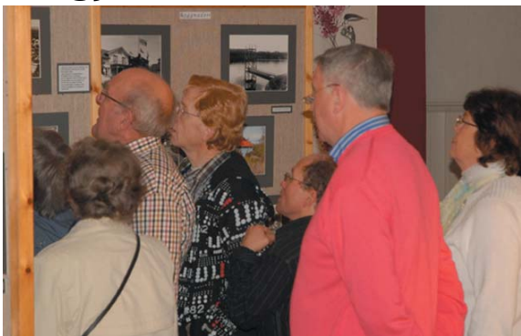
Intresset var stort och man studerade de gamla bilderna noga.