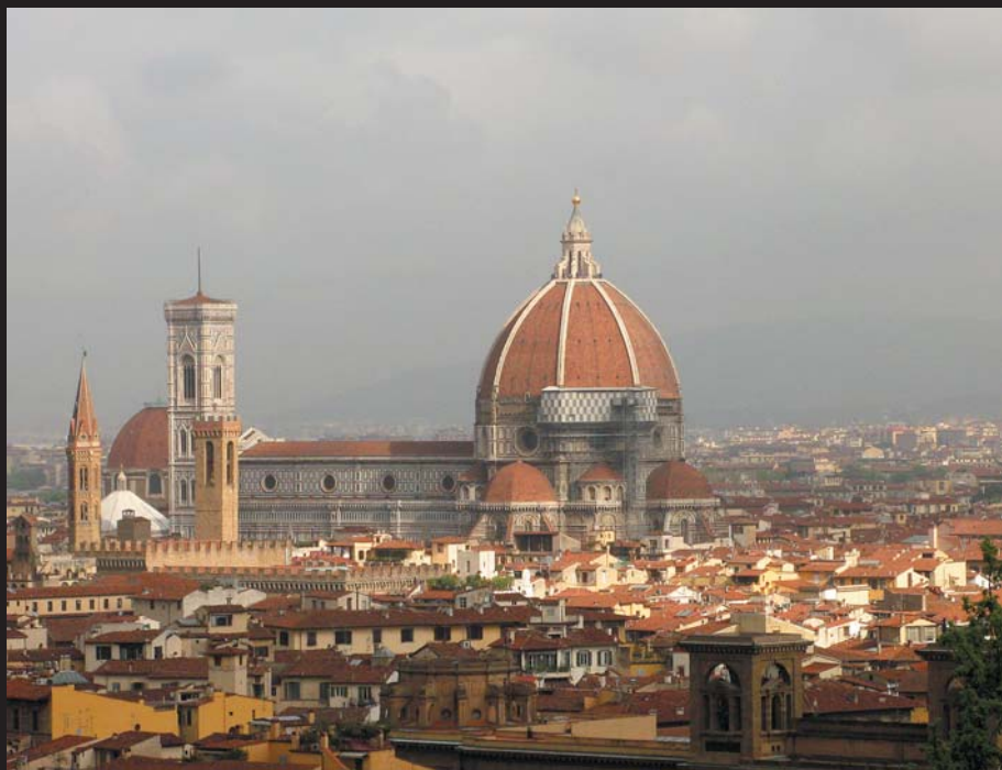
Santa Maria del Fiore