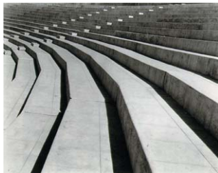
Stadium i Mexico City 1927.