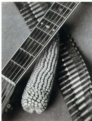
Bandolier, majs, gitarr 1927.