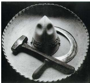
Mexikansk sombrero, hammaren och skäran 1927.