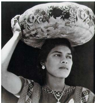
Kvinna från Tehautepec bärande jecaipixtle 1929.