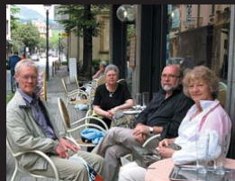
Ölpaus i Montecatini.