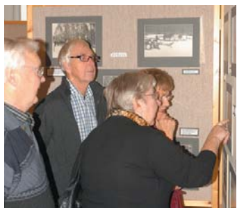
Titta här. Många mindes hur det var en gång i tiden.

Restaureringen har genomförts genom bidrag från Stiftelsen Förenings sparbanken Sjuhärad och utställningen genomförts genom stöd från Studiefrämjandet. Tack alla!