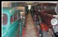
Vacker vy. Oh, så gott. Grillkväll. Gamla bilar.