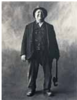
Plumber, New York City