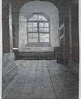
"Nyttigt" av Stefan Lindh, Hyssna - vann i svartvita klassen.