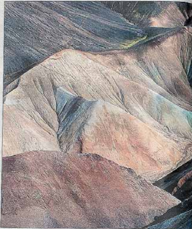
Vinnarbild: Landskapsbilder av Mikael Redhammar

Hyssna utmärkte sig i årets tävling.