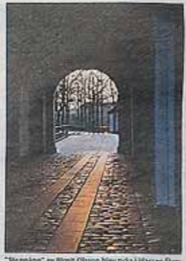
"Stengång" av Björg Olsson blev två i klassen färg.