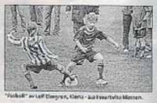
"Fotboll" av Leif Olsson, Kista - som tävlar i Märkmästarett.