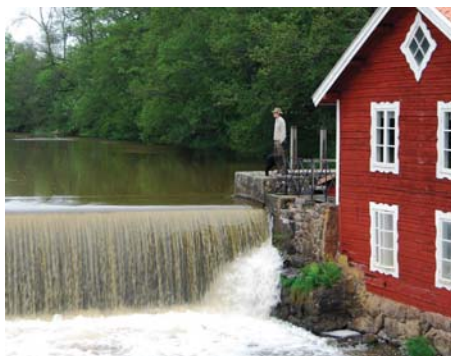
Reine med Nimbus vid Resville kvarnplats.

Där finns också en liten kyrkoplats. Kyrkan brändes av de hemska danskarna på 1500–1600-talet. Den kvarvarande kvarnbyggnaden bildar en fin miljö som lockade till fotografering.